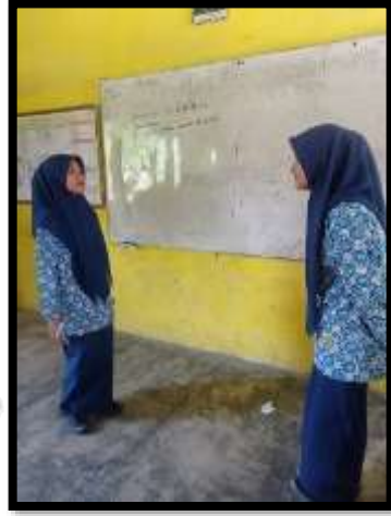
اختبار قبليّ واختبار بعديّ الصف الضابط