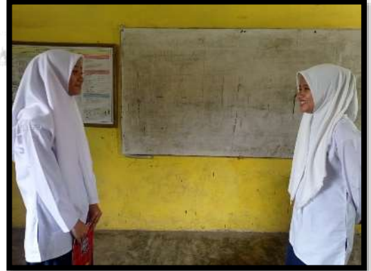
الصورة ٦- اختبار قبليّ واختبار بعديّ الصف التجريبي