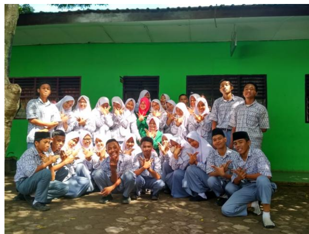
Gambar 3. Foto Bersama Para Siswa Kelas X Madrasah Aliyah Negeri 3 Medan