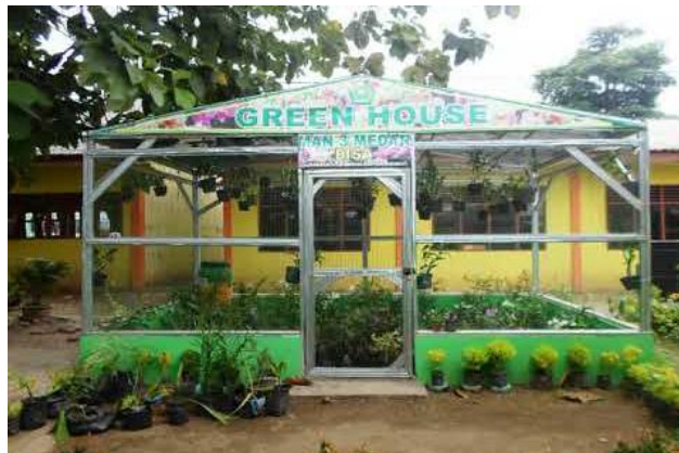
Gambar 1. Bangunan Madrasah Aliyah Negeri 3 Medan