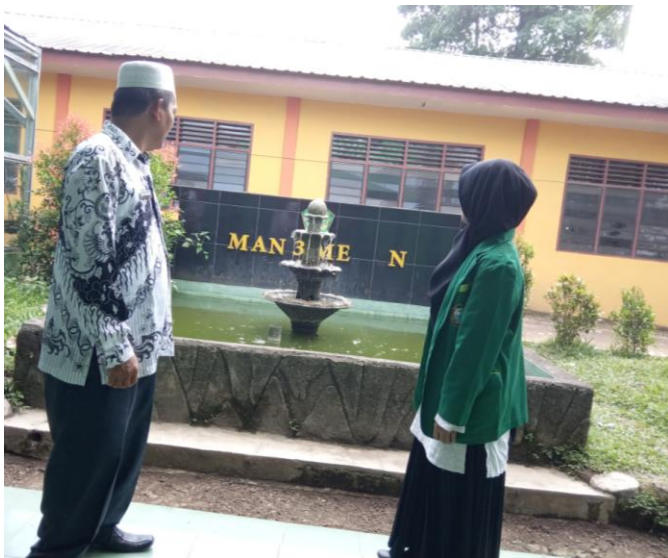
Gambar 2. Foto Bersama Guru Guru Dan Kepala Madrasah Aliyah Negeri 3 Medan