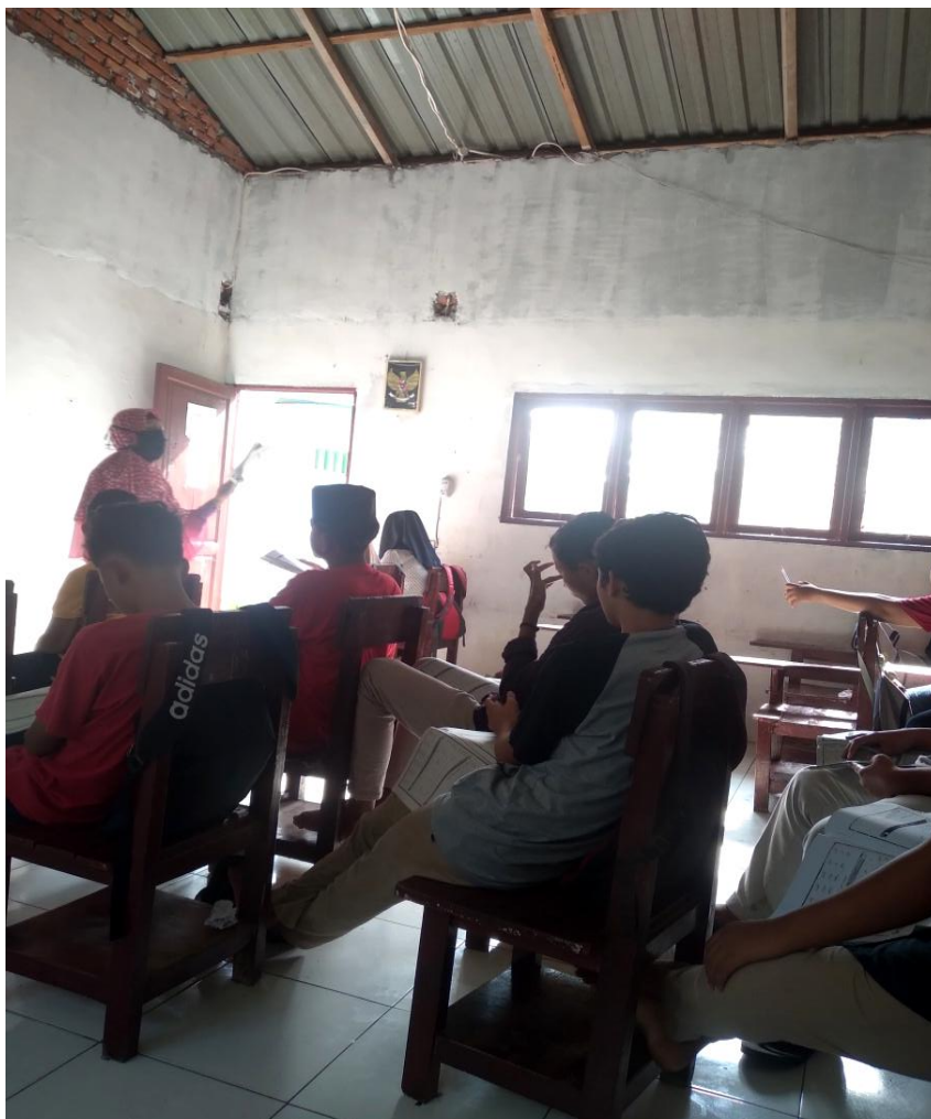
(gambar penerapan metode ceramah)