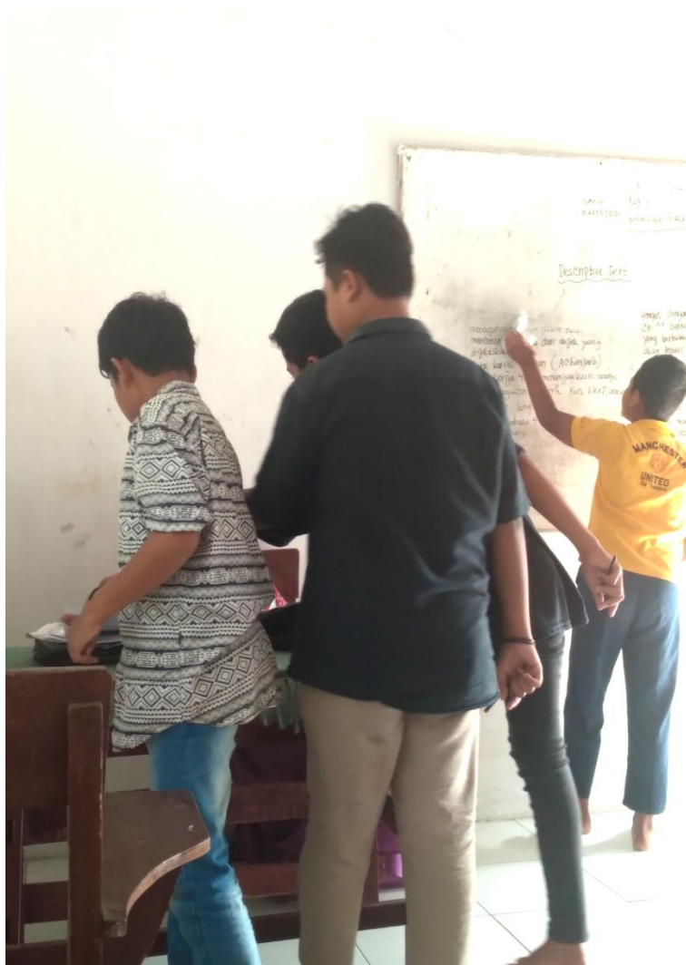
(gambar penerapan metode pengumpulan tugas)