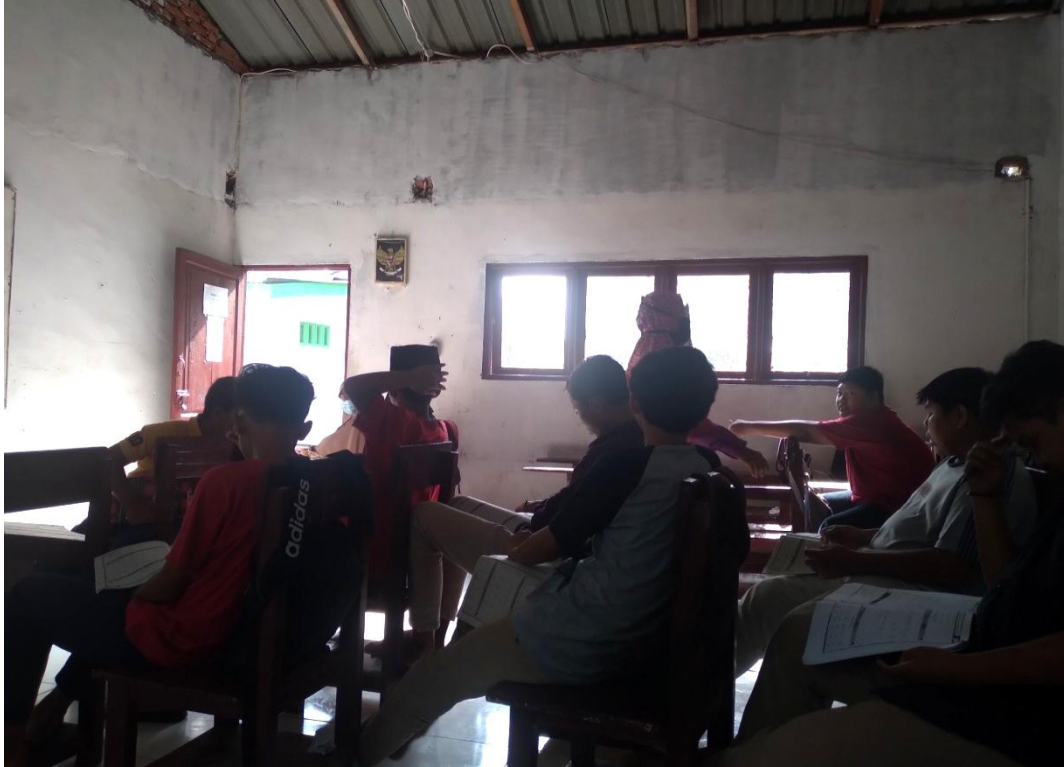
(gambar penerapan metode Tanya jawab)