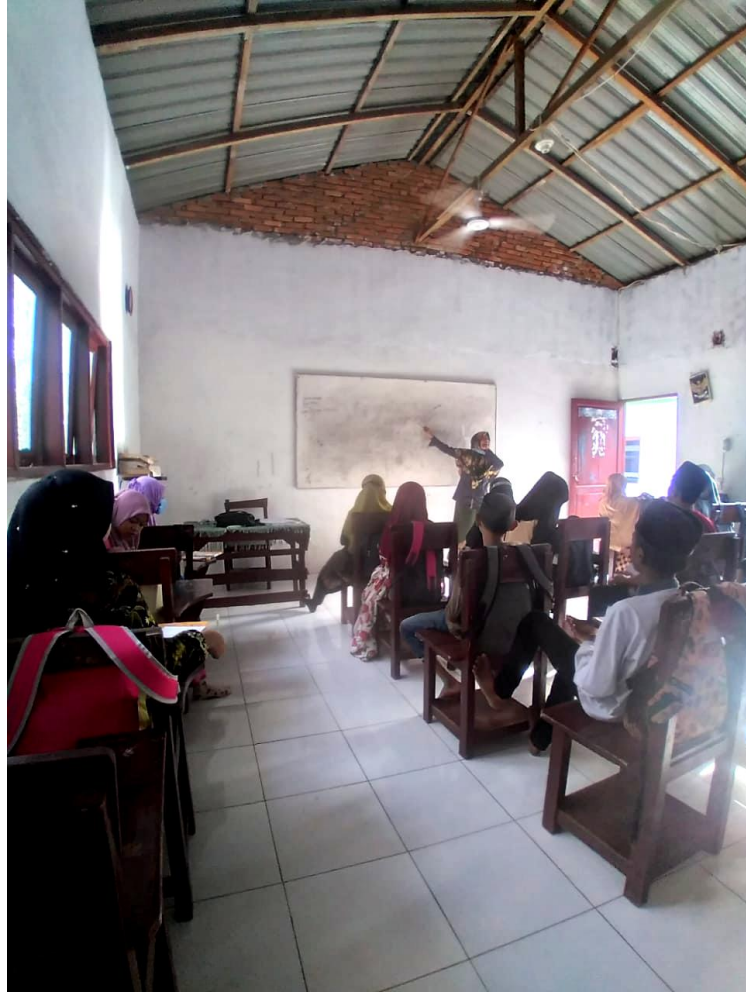
(gambar penerapan metode ceramah)