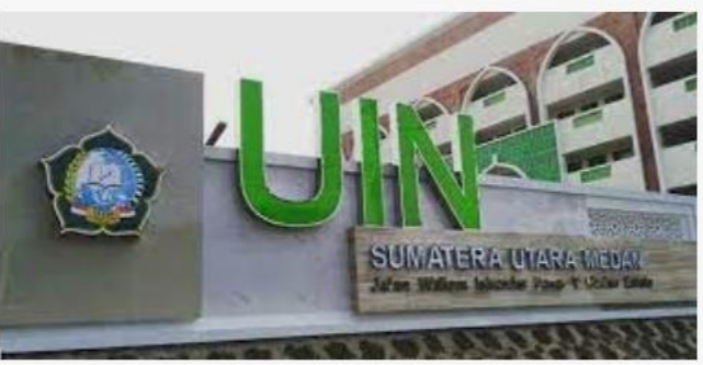
Investigasi: Oknum Pejabat UIN Sumut Diduga Donatur Demo dan ... gardamedannews.com

Bentrok di Kampus UIN Sumut, Mahasiswa Pecinta Alam Te... m.tribunnews.com