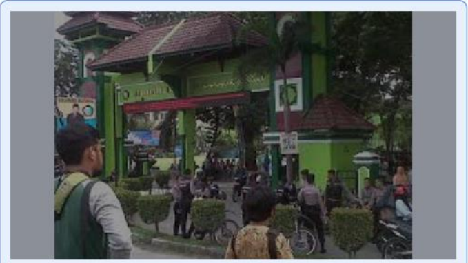
Mahasiswa UIN Sumut Bentrok, Sejumlah Mahasiswa L... beritasumut.com

Mahasiswa UIN Sumut bentrok gara-gara lapangan, 8 terluka | ... merdeka.com