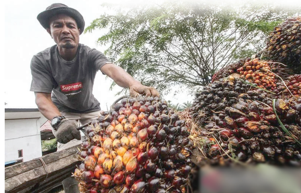
Pekerja mengumpulkan kelapa sawit di Desa Mulieng Manyang, Kecamatan Kuta Makmur, Aceh Utara, Aceh.