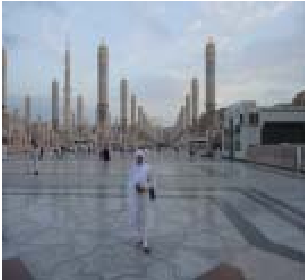
1. Tenda Masjid Nabawi