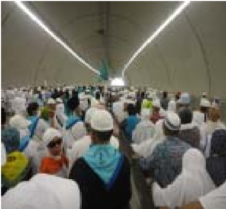
9. Terowongan Mina-Jamarat