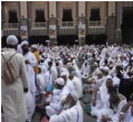
3. Jumatan di Jalanan