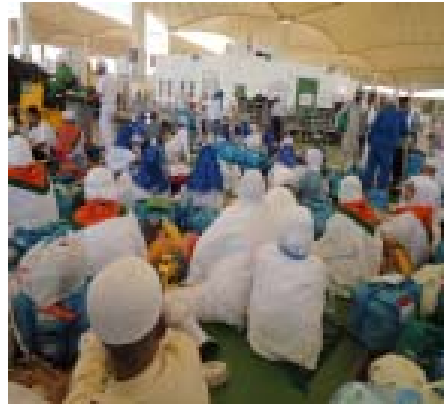
14. Bandara Jedah: Terlantar