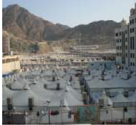
8. Tenda-Tenda di Mina