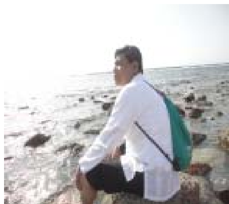
18. Di Pantai Laut Merah