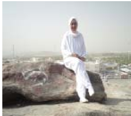
16. Di Jabal Rahmah 2