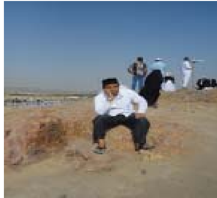
8. Di Puncak Bukit Rummat