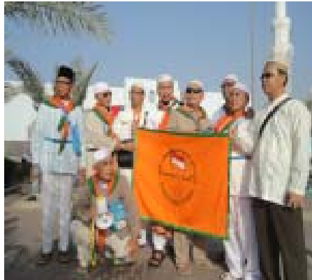
20. Salah Satu KBIH