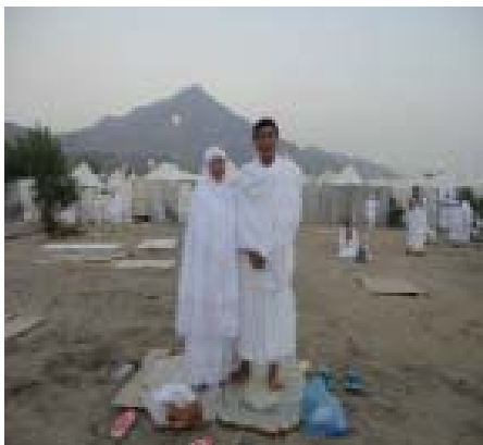
5. Wukuf fi Arafah 2