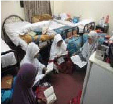
21. Khataman Qur'an