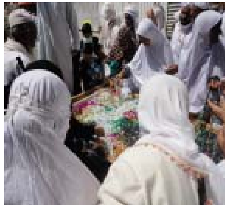
10. Belanja ... Belanja ... Belanja