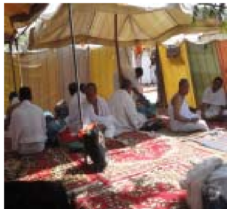
6. Suasana Tenda di Arafah