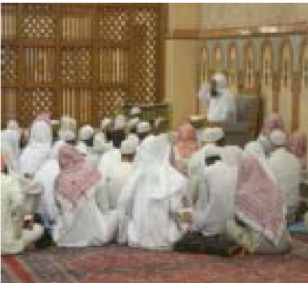
3. Halaqah Masjid Nabawi