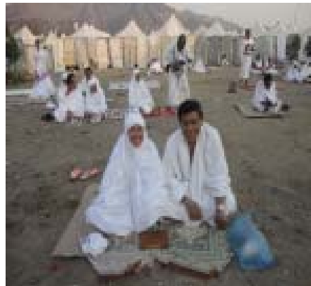
4. Wukuf di Arafah