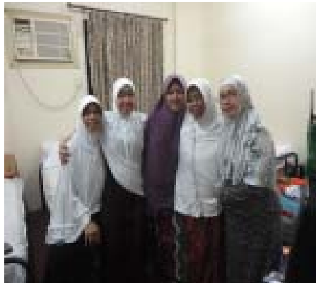
22. Sekamar, Kompak