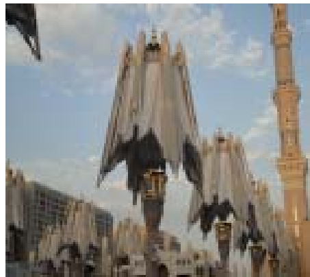
2. Tenda Masjid Nabawi 2