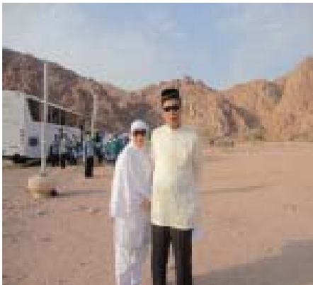
9. Di Bukit Magnit