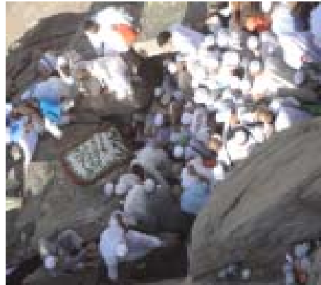
14. Berebut Masuk Gua Hira'