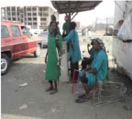
19. Para Jagal Pro