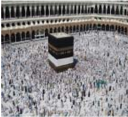
1. Ka'bah di Tengah Lautan Jamaah