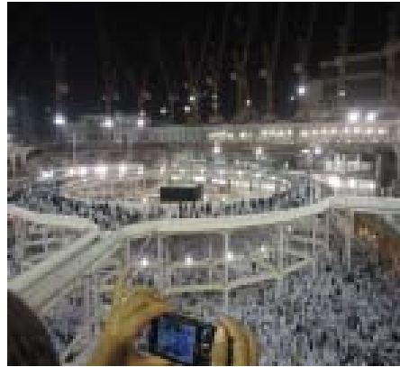
2. Masjidil Haram dalam Renovasi