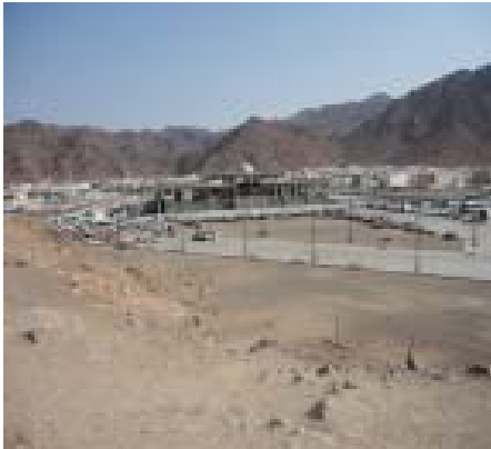
7. Lingkungan Uhud