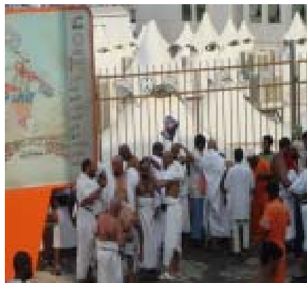
12. Baku Gundul