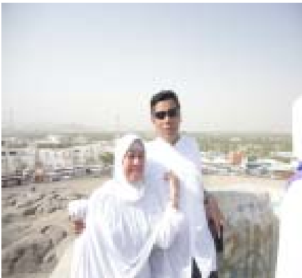
15. Di Jabal Rahmah