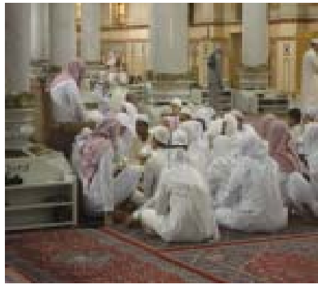
4. Halaqah Masjid Nabawi 2