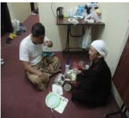
17. Rumah 611, Makan ber-2