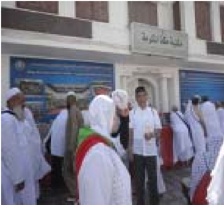
13. Tempat Kelahiran Nabi