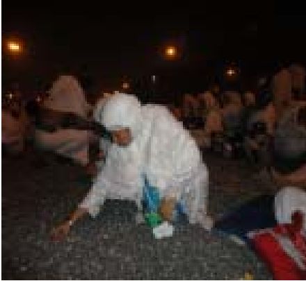
7. Mengutip Batu di Muzdalifah