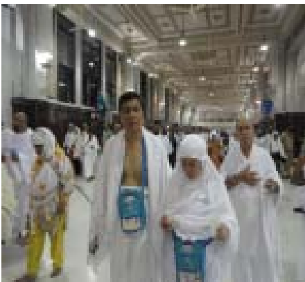
11. Lintasan Sa'i