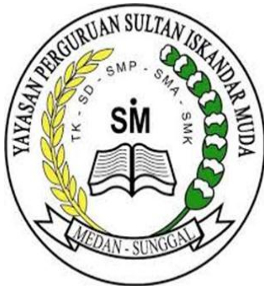
Gambar 2. Logo Yayasan Sultan Iskandar Muda. Sumber : Data YPSIM 2018