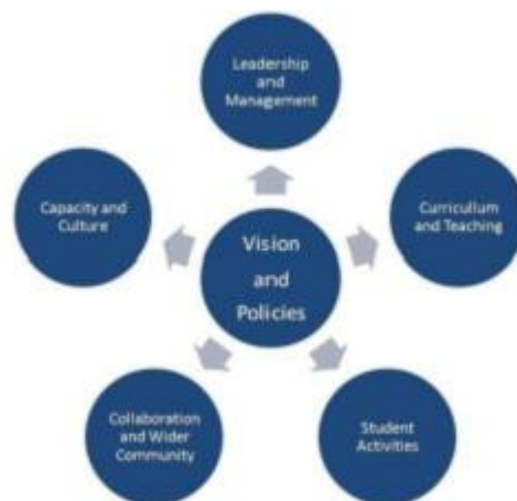
Gambar . Diagram 1. A Whole School Approach (Raihani, 2011: 30)

Sekolah YPSIM dalam mengimplementasikan teori dan konsep pendidikan multikultural menggunakan pendekatan yang disebut Whole School Approach