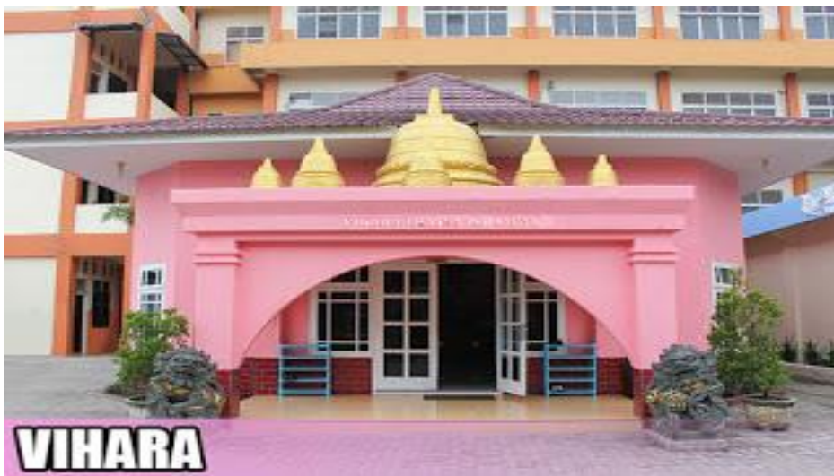
Gambar. Rumah ibadah Vihara yang dikelilingi oleh rumah ibadah lainnya.

“..Dengan rumah ibadah yang berdekatan ini, YPSIM menginginkan untuk membiasakan para anak didik melihat perbedaan dan mengajarkan kepada mereka bahwa perbedaan bukan berarti tidak dapat berteman dan hidup bersama. Begitu juga akan dibangun aula bung Karno sebagai wujud perekat nasionalisme diantara rumah ibadah yang jaraknya berdekatan, “ kata Sofyan Tan (59)