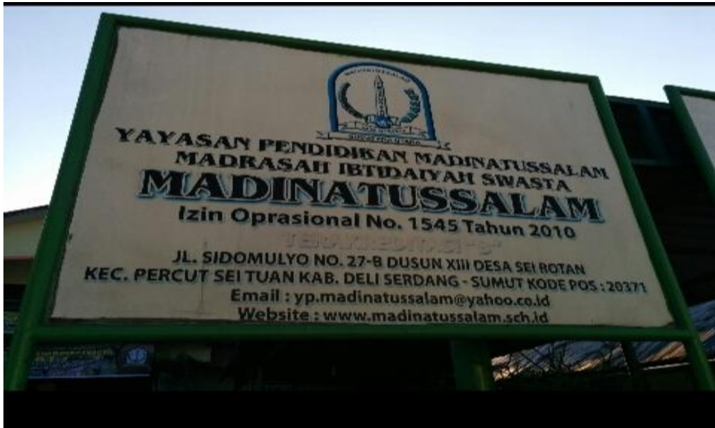
Gambar 1: Depan Sekolah