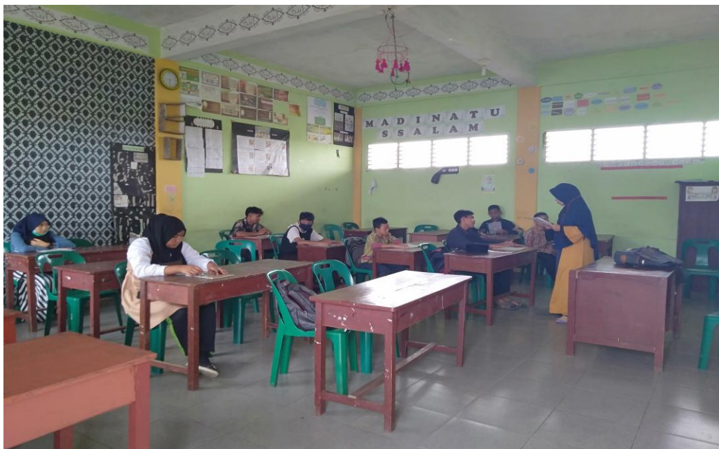
Gambar 2: Menjelaskan Materi