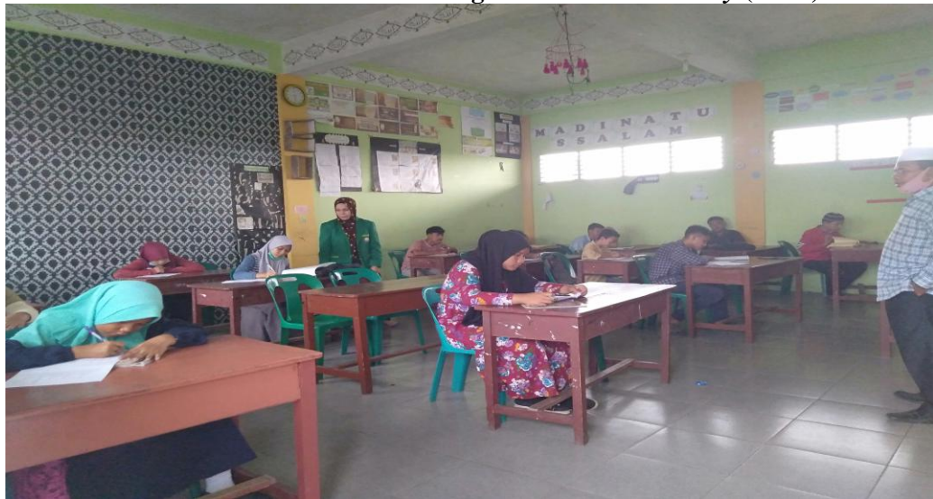
Gambar 4: Siswa Mengerjakan Tes