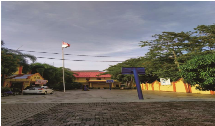
Lapangan Madrasah Aliyah Negeri 1 Medan