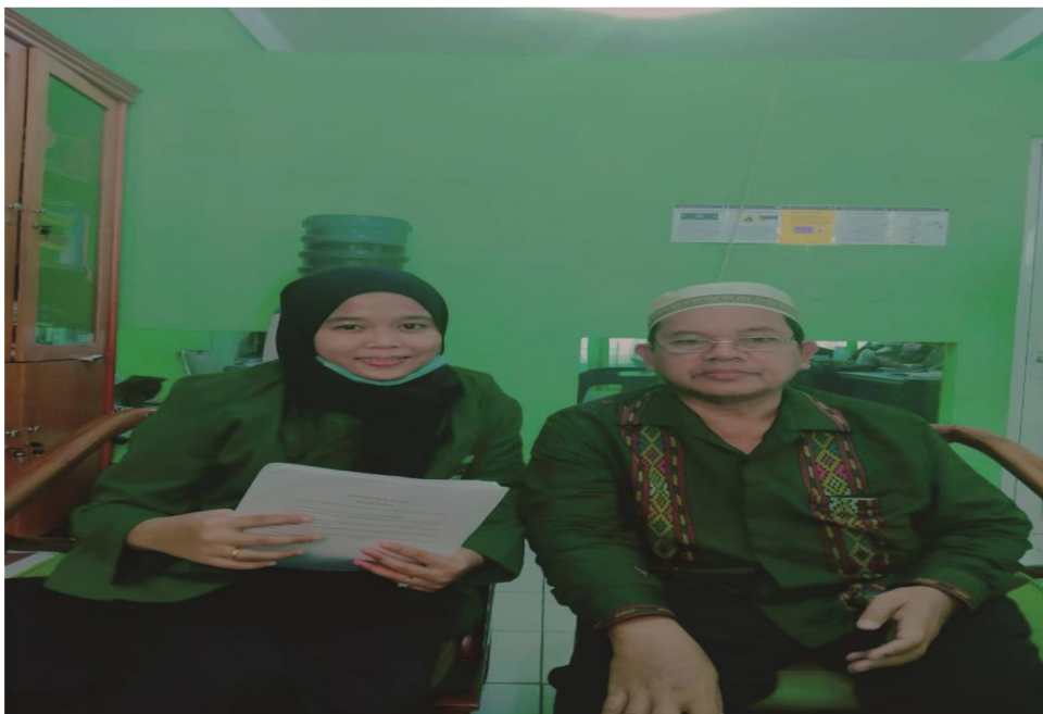
Wawancara kepada Guru BK Madrasah Aliyah Negeri 1 Medan