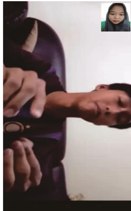
Wawancara Kepada Siswa Madrasah Aliyah Negeri 1 Medan