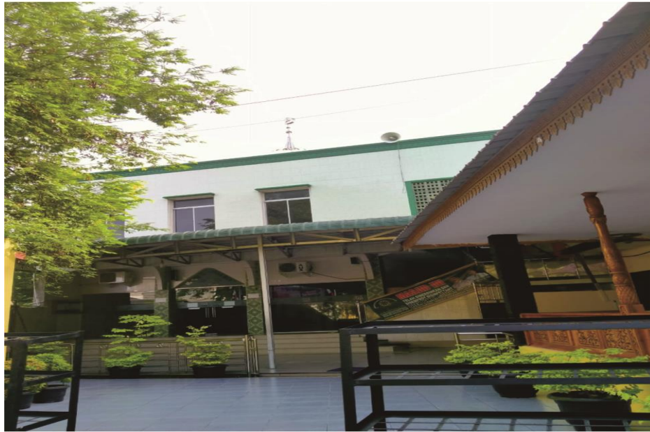
Masjid Madrasah Aliyah Negeri 1 Medan