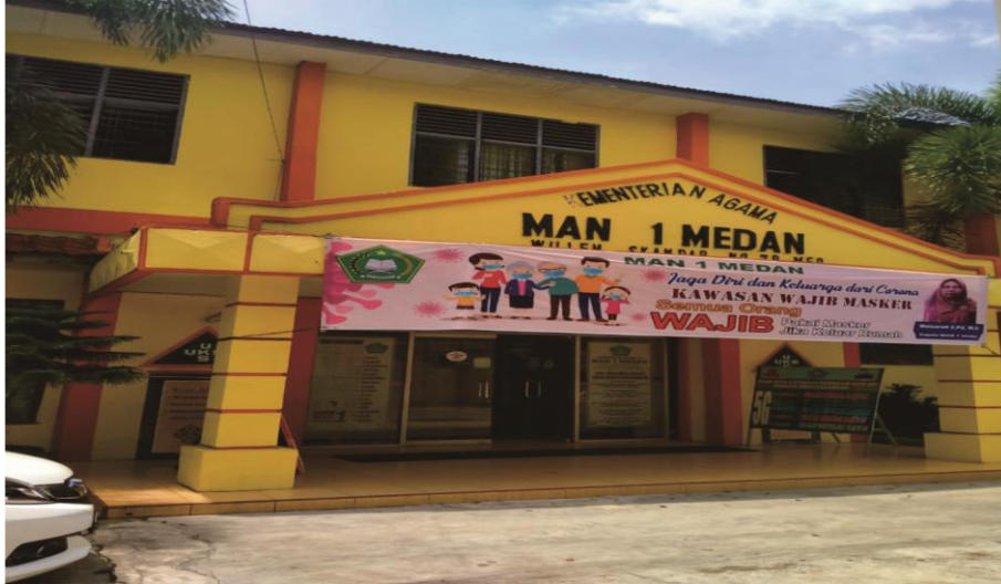
Gerbang Pintu Madrasah Aliyah Negeri 1 Medan