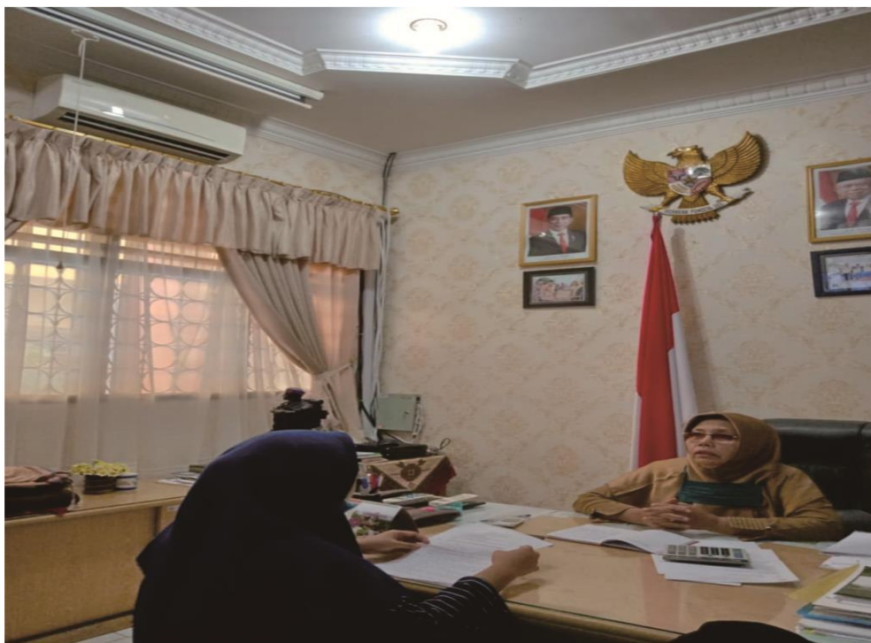
Wawancara Kepada Kepala Sekolah Madrasah Aliyah Negeri 1