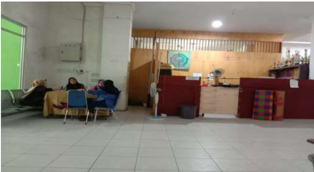
غرفة توجيه المشورة ومكتب الاعتصام المعلم