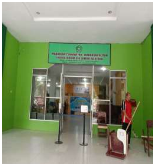
مبنى ومدخل مدرسة الثانوية لبولاتوريوم الجامعة الإسلامية الحكمية سومطرة الشمالية