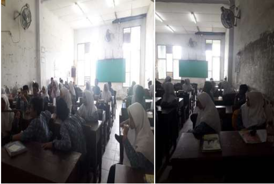
أنشطة تعلم الطلاب