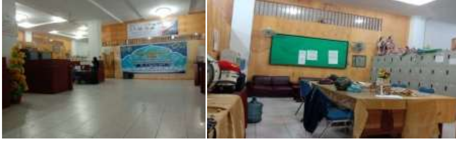
غرفة المعلم وصورة في مبنى المدرسة الثانوية لبولاتورثوم الجامعة الإسلامية الحكيمة سومطرة الشمالية