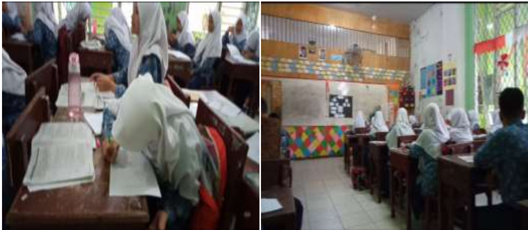
باحثة تشرح طريقة الخريطة الذهنية قبل الدورة