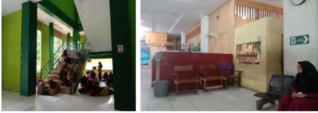
كرسي انتظار لضيوف ويتعلم الطلاب بمناقشون خارج الفصل الدراسي