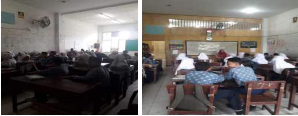
الباحثة التعرف وتنقل القصد أهدافها إلى الطلاب