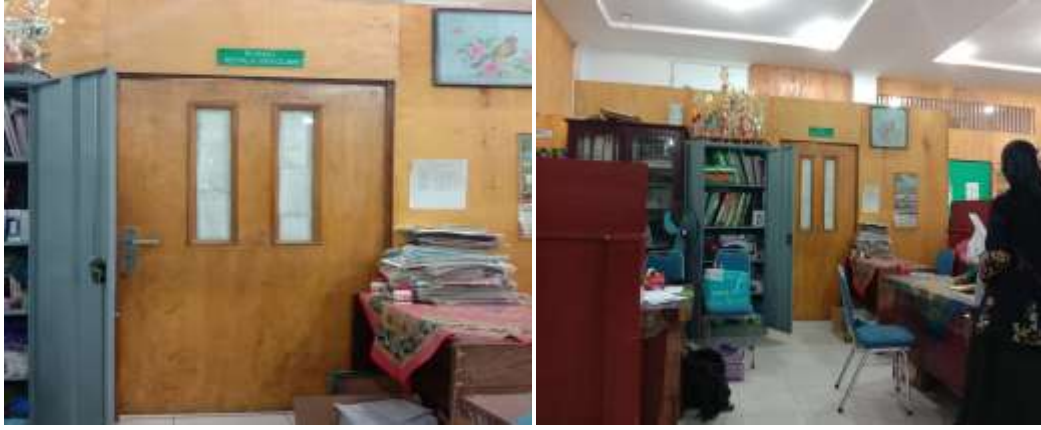
غرفة المدير وغرفة الإدارة