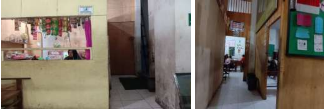
الفصل, والحمام والمقصوف